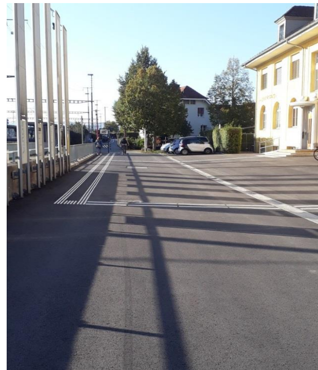
Bodenmarkierung für Sehbehinderte