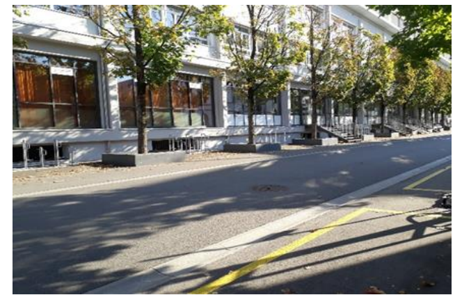
Blick Richtung Lenzbürgi-Haus / Gleis 1