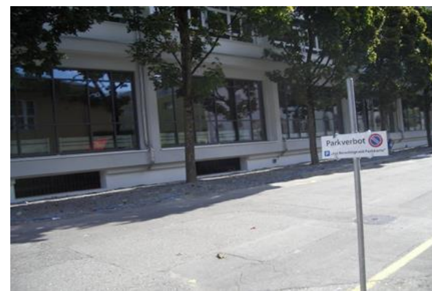
Blick Richtung Lenzbürgi-Haus mit Bushaltestelle in Beton